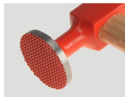
سطح آج خورده Milled cross-hatched face